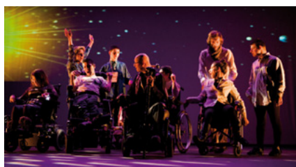
C crédit photo : Pascal Gleizes

Une volonté de faire connaître et faire naître un spectacle avec des professionnels en collaboration avec des structures spécialisées pour des personnes polyhandicapées.